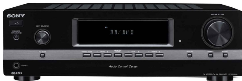
R-I-P. Phillips Stereo Cassette N2214 en WELKOM Sony STR-DH100 2-Channel Audio Receiver