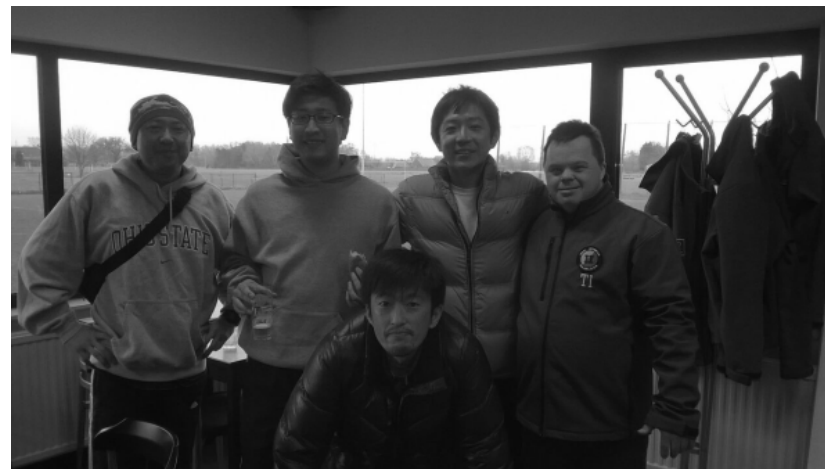
T1 van den II verbreedert met 3 van J